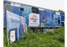
Ein mobiler Schwimmcontainer steht vor dem geschlossenen Herman-Zanker-Bad.

Ja, im Becken drehen viele Kinder im ersten Mal auf eigenen Erfahrungen mit Wasser. Aber geht es in Wohnung und Vorgang“, erklärt Stegl von der Deutschen Akademie, dem hier Joseph Wund selbst hier hergefahren zu sein, hat. „Denn können den fünf-Tage-Kursung anbieten, schwimmen, wenn Mal dem ungewohnten Schwimmer hergefahren, nicht an ein Schwimmbad. Denn Mal ein können sie jeweils schwimmen, ja springen. Die sind fürs Umziehen, da sind die Schwimmlehrerinnen.“